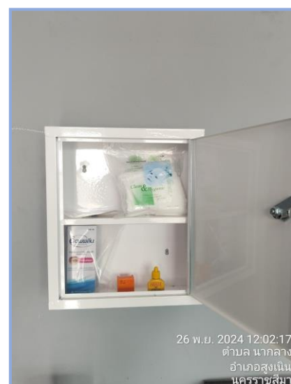
อุปกรณ์ปฐมพยาบาล

ภาพที่ 3.2-3 ภาพแสดงป้ายเตือนตามแนวท่อโครงการวางระบบจำหน่ายก๊าซธรรมชาติไปยัง เขตส่งเสริมอุตสาหกรรมนวนคร (นครราชสีมา)