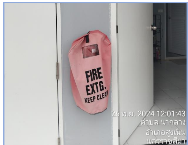
ถังดับเพลิง