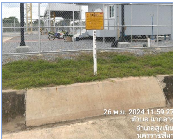
ป้ายเตือนแนวท่อส่งก๊าซฯ