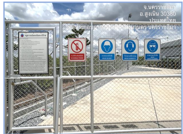
สถานีควบคุมความดันและวัดปริมาตรก๊าซ (MRS) และป้ายเตือนต่าง ๆ